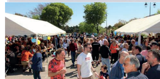
La réussite d'une fête familiale.

Notre association « J'aime Poulx tout simplement » vous donne rendez-vous le samedi 8 avril 2023 même heure même lieu et toujours dans la joie et la bonne humeur.