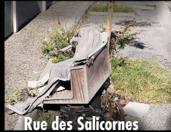
Rue des Salicornes