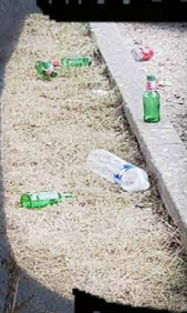
Rue de la Pinède