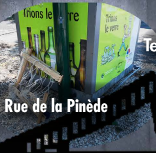
Rue de la Pinède

Tel est le nom de la majorité du conseil municipal élue en 2014 aux dernières élections.