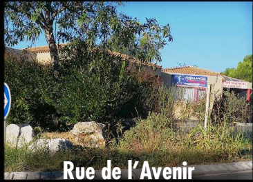
Rue de l'Avenir