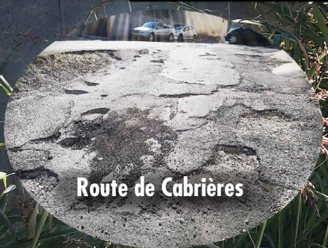
Route de Cabrières